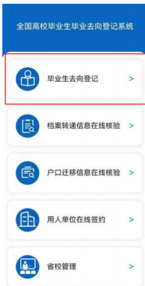
图 2 选择登录用户

登录方式二：通过手机端搜索登记系统网址 dj.ncss.cn ， 点击“毕业生去向登记”，使用学信网账号登录。