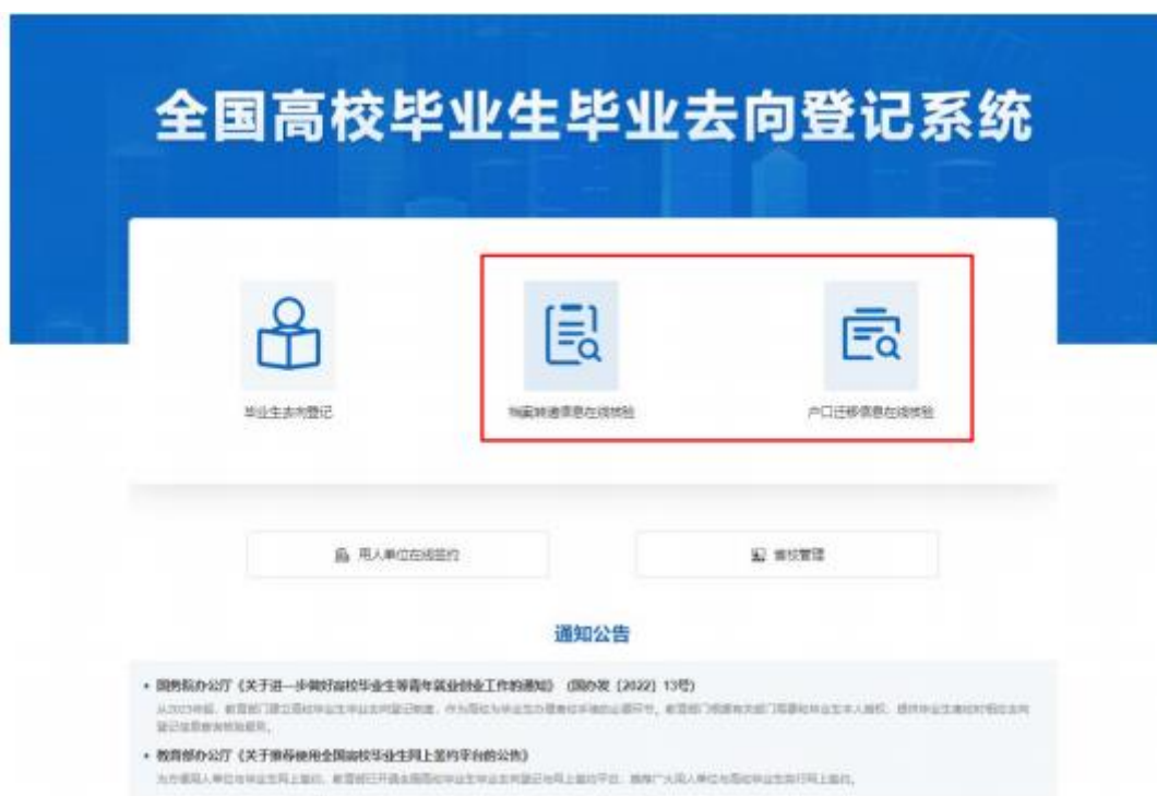
图 9 登记系统查询核验入口

查询核验主要有两种方式。方式一：在登记系统点击“档案转递信息在线核验”或“户口迁移信息在线核验”，输入毕业生姓名和核验编号在线核验；方式二：使用学信网 APP，扫描去向登记信息表二维码进行核验。