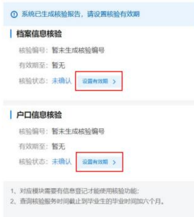
图 8 核验授权主界面

毕业生设置去向登记信息表有效期，设置完成后可查看下载去向登记信息表，根据档案或户籍接收管理部门的核验需求，将核验信息提供给相关部门。