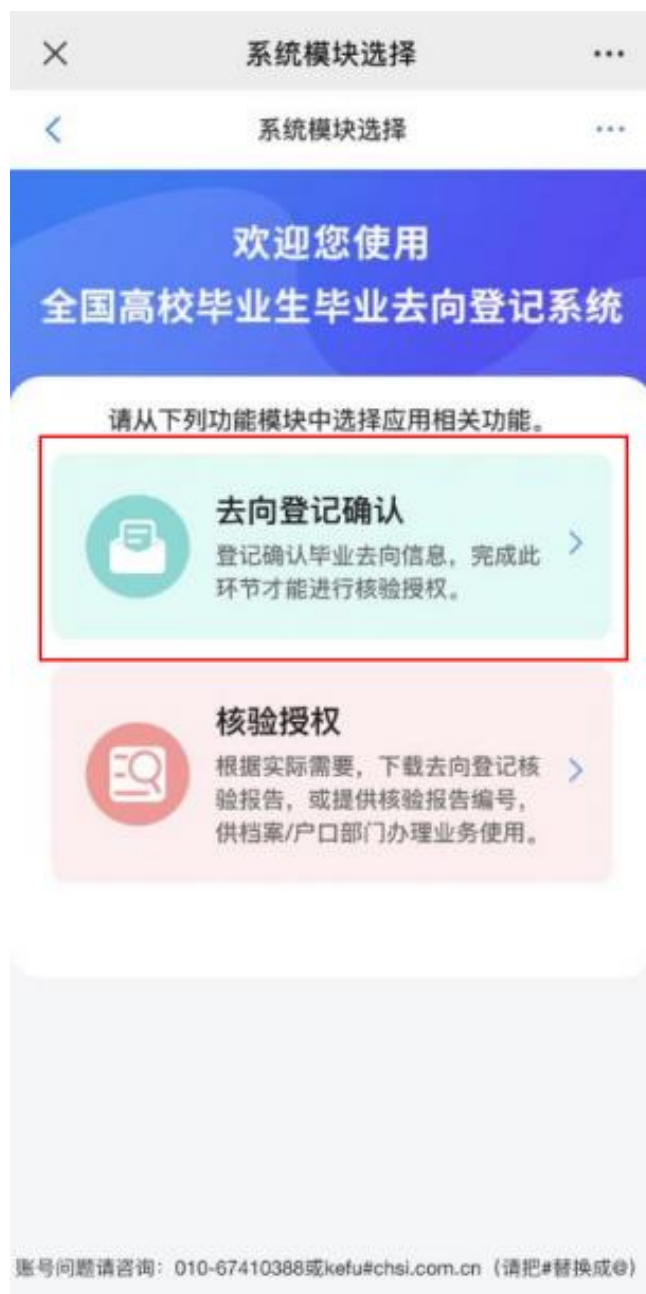
图 5 选择功能模块

于授权档案和户籍接收管理部门查询核验本人的去向登记信息，供相关部门办理转档、落户使用。毕业生需完成去向登记确认才能进行核验授权。