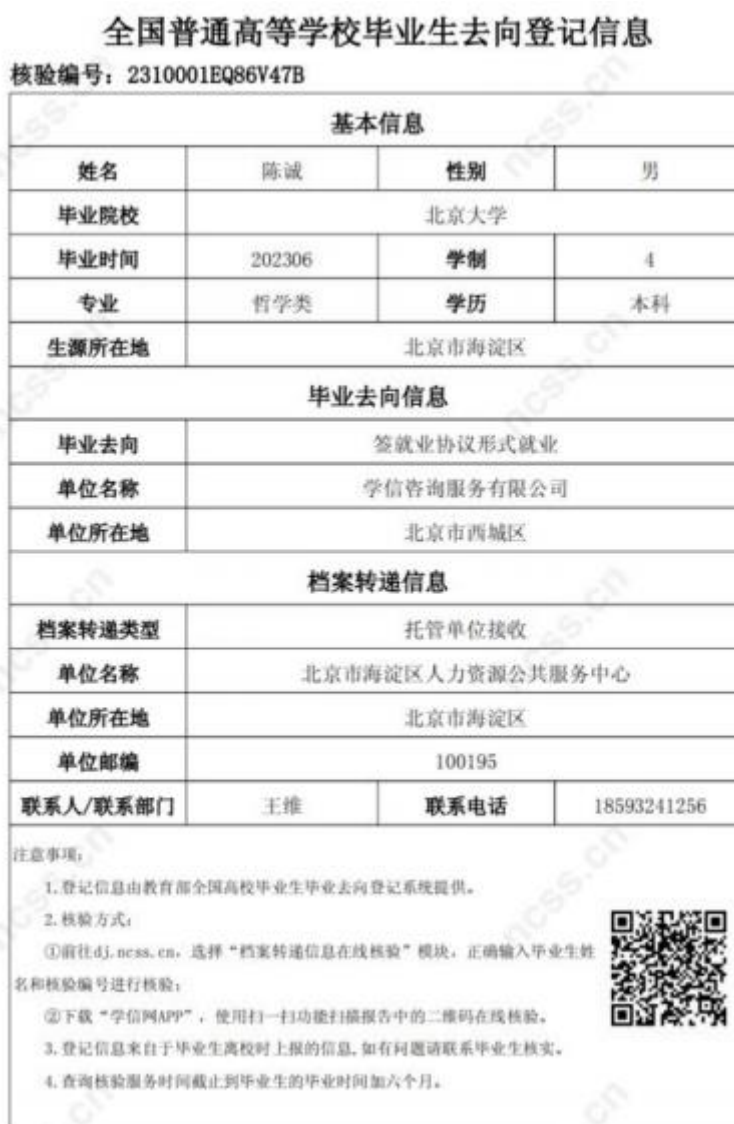
图 8 去向登记信息表（档案登记信息表）

去向登记信息表分为档案登记信息表和户口登记信息表，内容主要包括 核验编号、核验二维码、基本信息、毕业去向信息、档案转递信息或户口迁移信息 。若毕业生在核验授权时尚未登记档案转递信息或户口迁移信息，则去向登记信息表将不展示档案转递信息或户口迁移信息。