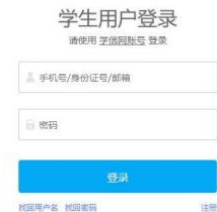
图 3 用户登录